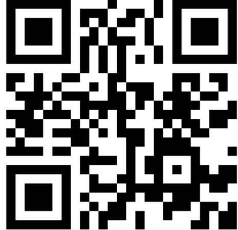
Obrazac za prijavu