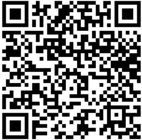
Web stranica 6. DMI